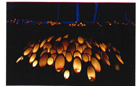
※昨年度の写真です